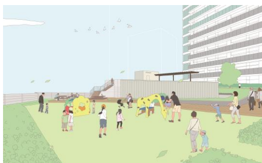
エアリーガーデン（駐車場棟屋上緑化）イメージ