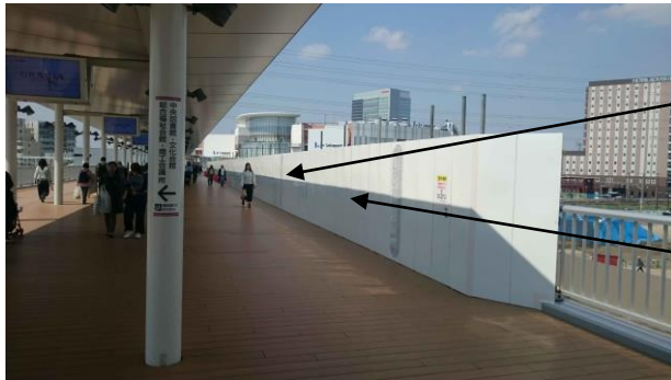
海老名駅自由通路(駅間部)