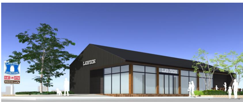
ローソン ビナガーデンズ店（イメージ）