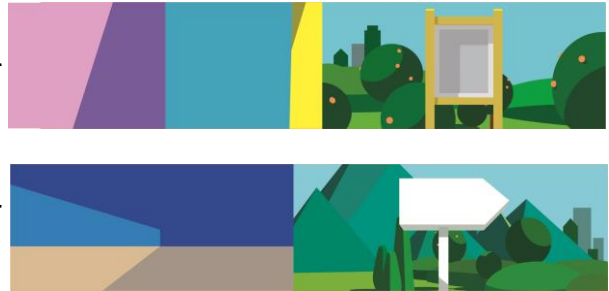
同所に設置される仮囲いアートのイメージ