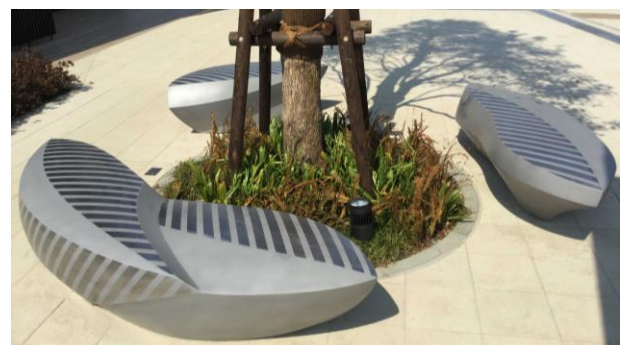
アートベンチ「百色の雲」